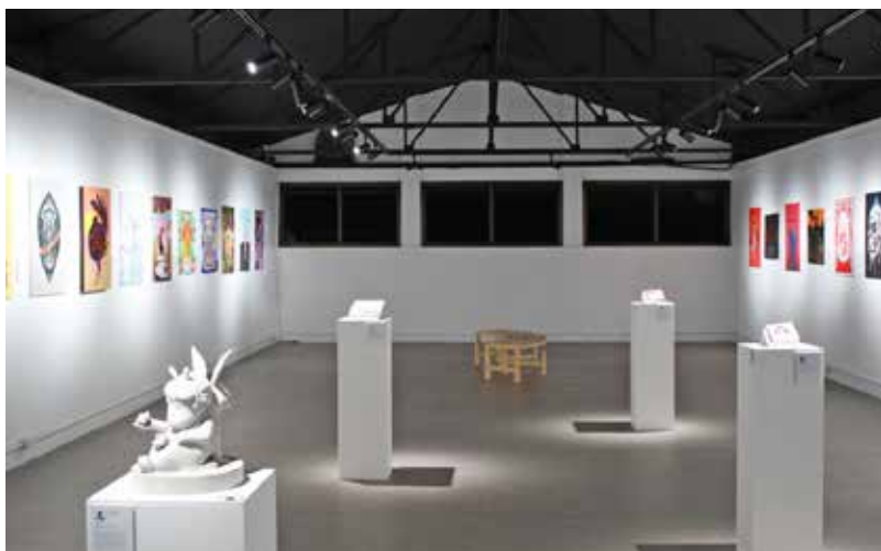
Sala 4 del MADC con la muestra de La Tina.

Se recuerdan momentos de tensión en el istmo, como el enfrentamiento entre el Frente Sandinista y la contra en Nicaragua; el asesinato de Monseñor Romero en El Salvador, o cuando los helicópteros artillados vaciaron sus cañonetas borrando en el mapa la barriada de “Chorrillos” durante la invasión a Panamá, incluso tensiones en el territorio nacional como las huelgas bananeras, Alcoa 1970, entre otros. En estos discursos siempre estará inmersa la palabra política, pero reformulada por la crítica creativa de los y las artistas centroamericanos.