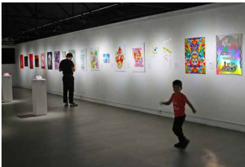
Sala 4 del MADC con la muestra de La Tina.

the contras in Nicaragua; the assassination of Monsignor Romero in El Salvador, or when the helicopter gunships emptied their cannons, erasing the “Chorrillos” neighborhood from the map during the invasion of Panama, even tensions in the national territory such as the banana strikes, Alcoa 1970, among others. The word politics will always be immersed in these speeches, but reformulated by the creative criticism of Central American artists. LFQ. February 2025