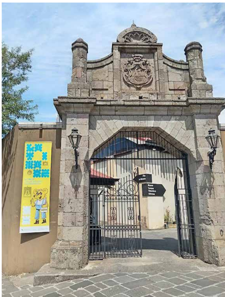
Entreda al MADC, Centro Nacional de Cultura. 2025